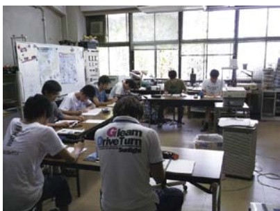
過去問題集に取り組む学生たち