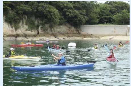
シーカヤックに挑戦

8月20~22日、呉市蒲刈町の県民の浜周辺にて、「生涯スポーツA」の授業を行いました。33名の履修学生は、海浜でのテント生活を行いました。昨今は林間学校などの学校行事も少なくなり、テント生活が初めての学生も多いようです。学生たちは、生活班で事前に食事の献立を考え、買い出しや自炊調理を行う中で徐々に親睦を深めてゆき、会話も弾んでいたようです。また、自然の中で生活する技術や知識も豊富になり、日に日にたくましくなってくれたように思います。マリンスポーツは、シーカヤック、ウインドサーフィン、スクーバダイビングを体験しました。これらのスポーツは個人的に体験することはなかなか難しい種目で、授業として体得できるのはとても有意義なことだと思います。これらの体験が、今後の学生生活をより豊かなものにし、人間的に強くたくましく、さらにはリーダーシップを醸成するきっかけになってくれることを期待しています。また、スポーツの趣味として生涯定着することになれば幸いです。