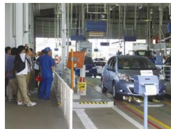
安全走行に欠かせない車検の現場を見学

自動車整備士を志す1年生の学生にとって、普段の講義や実習と実際の現場との関連性がより明確になった見学でした。