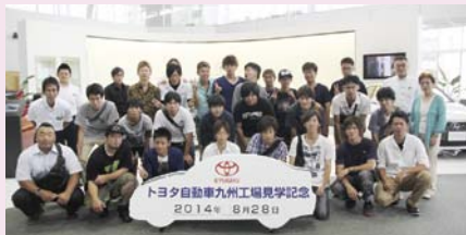
先端技術の粋を集めた工場を見学

見学後はマリンワールド海の中道で、イルカショー、パノラマ大水槽の中でダイバーが繰り広げるアクアライブショーやサメの大群などを鑑賞しました。