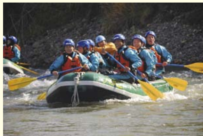
北海道（ラフティング体験）

2学年は10月16～20日、4泊5日の日程で修学旅行に行きました。行先は北海道、沖縄そしてグアム、台湾の4コースです。各コースが1年次より計画を練り、準備を進めて旅行当日を迎えました。