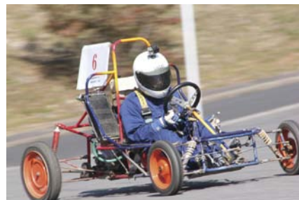
参加者自慢の愛機がキャンパスを駆け抜けた

また、競技中もドリフトターンを随所で披露され、運転の技も相当なものでした。お子様連れでの参加もあり、一部でアットホームな雰囲気も感じられた大会でした。参加者の皆様方のご協力で事故もなく、また終了後にはゴミひとつなく、とてもいい大会となりました。最後に、オフィシャルを務めてくれた学生諸君にも感謝いたします。