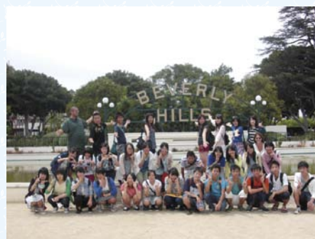
アメリカ・カリフォルニア州での語学研修に参加した生徒たち