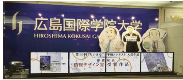
受賞作品展示の様子。傑作の数々を迫力の大画面で紹介した