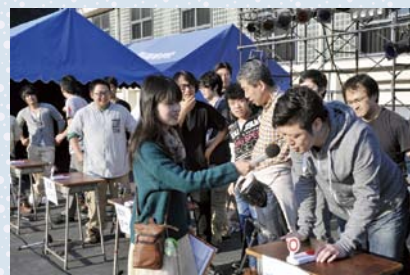
学生・教員のチームで競った学科対抗クイズ

ここ数年雲行きが怪しい中で行われていましたが、1日目の当夜祭は快晴の中、気持ちよくスタートを切ることができました。ステージ企画ではカラオケ大会予選、学科対抗クイズなどを行いました。カラオケ大会は例年よりはるかに多い10組以上の参加者が出場し、非常な盛り上がりを見せました。学科対抗クイズは、各学科の教員と学生が一致団結し優勝賞品を目指して火花を散らし合いました。当夜祭恒例のビンゴ大会は、前回のよう最後まで豪華景品が残るというドラマのような展開を期待していましたが、早々と大型テレビを当てられるという大波乱。しかし、他にも様々な豪華景品があったため、多くの方々にご満足いただけたと思います。