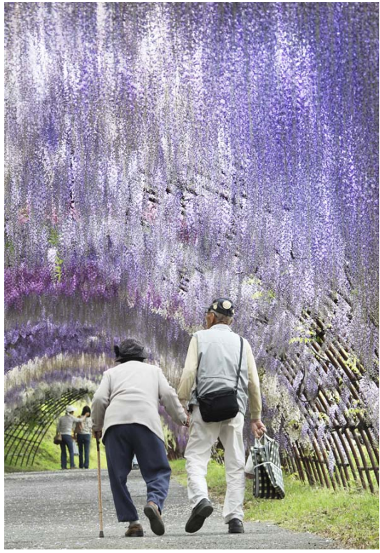
情報デザイン賞：いつまでも一緒に

皆様と共に平和について考える機会とすべく、被爆70周年の2015年も「“ちいさな”平和コンテスト」第11回を開催する予定です。