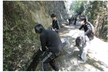
側道の水路の清掃

今回の1年生の活動は、井仁地区に住む営農者支援という側面もありますが、高齢化、農業、環境や国土保全といった点について考えるきっかけになったことでしょう！