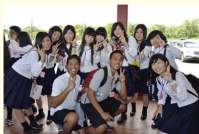
グアム（現地生徒と交流）

参加した全ての生徒が大きな怪我や病気、トラブルに見舞われることなく帰ることができました。旅行会社の方々をはじめ、