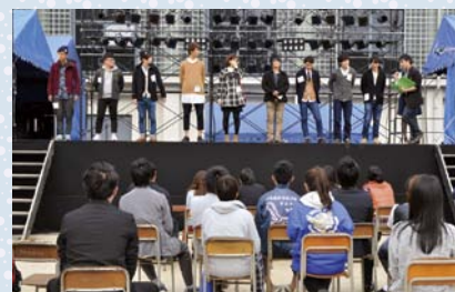
大学選り抜きのファッションistaが勢揃い

今回も無事高城祭を終えることができました。地域の皆様と本学の教職員、学生の皆様、系列高校の皆様、お世話になった関係企業の皆様等、様々な支えがあって私たちの祭が行えたことに感謝しております。本当にありがとうございました。次回もよろしくお願いいたします。