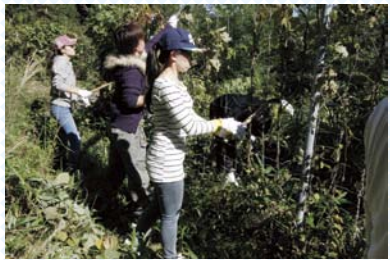
フェンスに絡まった蔓の除去と周辺の清掃

10月19日、現代社会学科の1年生が日本棚田百選にも選ばれた井仁地区(広島県山県郡安芸太田町筒賀)で、棚田に水を送る水路の清掃を行いました。