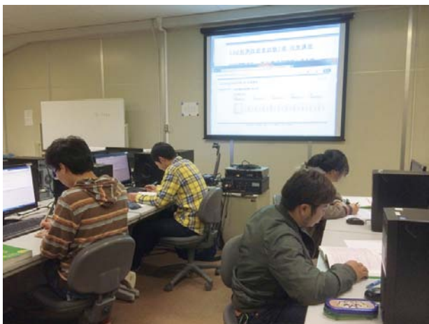
CAD利用技術者試験対策講座の様