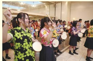
沖縄の高校生と交流