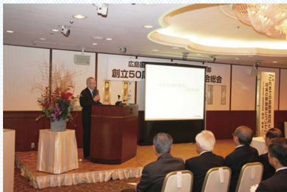
農沢氏による記念講演