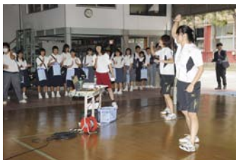
体育館での学校説明

9月20・21日にオープンスクールを開催しました。毎回多くの中学生・保護者のみなさんに本高校の魅力を体験してもらっていますが、今年度は前年度を凌ぐ2,500名近くの方が来校しました。