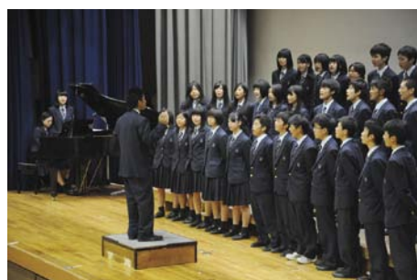
システム変更でさらにレベルアップした合唱祭

2つめは1年生合唱祭です。今までは結果発表を含めすべて1日で完結していましたが、今年度は1日目に予選を行い、学年の半分が翌日の決勝に出場する権利を得るといふシステムになりました。1日目はどのクラスも入賞に向け予選を突破し、最高の舞台を作るために気合が入っていました。決勝に残った6クラスの発表は、一段と発展したステージへと進化していました。どのクラスも一致団結し、目標に向かって日々努力し発展させていった成果が出ていました。