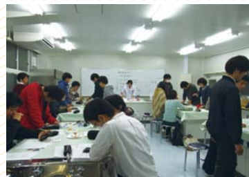
鮮度の違う3種の卵を用いた実習

すでに大学祭でパイオピザを、系列高校普通科の2年生を招いた「おもしろ技術体験」でパンを作り、本学科の授業「調理科学」でも各種実習を行いました。今後さらに楽しく充実した教育を行います。ぜひ一度見学にお越しください。