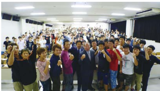
授業終了後、受講生と笑顔でガッツポーズ

挙に出馬して落選、3億円もの借金が残って自殺を考えたことも語りました。先生は「一生懸命はアマチュア、プロフェッショナルは一所懸命。ひとつのことに集中するのがプロ」、「運というのは、そこらへんにたくさん飛んでいて、努力する人のところにくっついてくる」などと印象的な言葉で語り、受講生は真剣に聞き入りました。