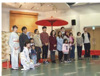
国際色豊かなお茶席に客も主人も笑顔

11月16日、広島市留学生会館で「お茶席体験」が開催され、留学生会館からの依頼を受けた本大学の表千家流茶道部が留学生たちにお点前を披露しました。