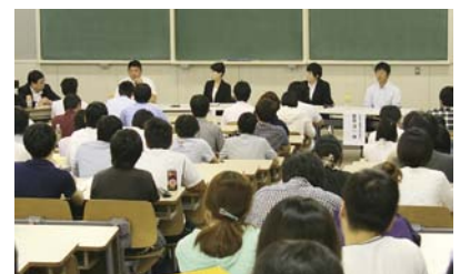
先輩たちの体験談に聴き入る学生

9月8~13日の6日間、工学部、情報デザイン学部3年生の必修科目「キャリアデザインI・II」の集中講義を行いました。炎天下、就職環境の理解、就職活動の進め方、エントリーシートの書き方等、講義と演習に真剣に取り組んでいました。今年度は、卒業生を招いてのパネルディスカッションも実施、先輩の体験談に身を乗り出して聴き入っていました。最後の面接演習では、リクルートスーツ姿で、本番さながらに、面接官役からの鋭い質問に、一生懸命答えていました。来年度から就職活動開始が遅れるため、より一層事前準備の周到さが求められ、緊張感が漂った集中講義でした。